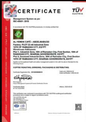
ISO 45001 na rok 2018 dot. bezpieczeństwa i higieny pracy