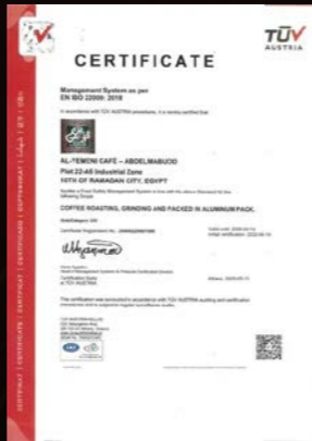
ISO 22000 na rok 2018 dot. bezpieczeństwa żywności w Egipcie

Zamykamy w tym ziarnie coś więcej niż aromat. To Smak, którego nie podrobisz i Historia, której nie kupisz.