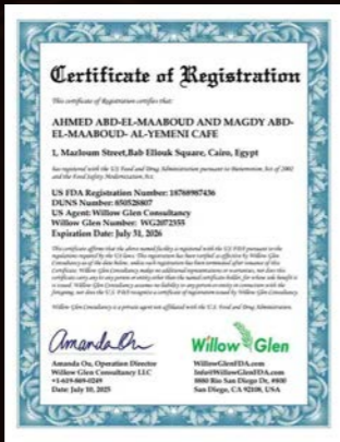
2025 – rejestracja w amerykańskiej Agencji ds. Żywności i Leków