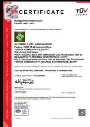
ISO 14001 na rok 2015 dot. wdrożenia normy zarządzania środowiskowego